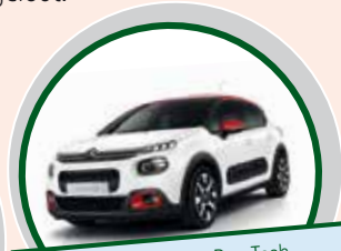
Ein Citroen C3 PureTech vom Autohaus Wolfgang Stahl