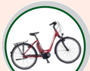
Ein Kreidler E-Bike